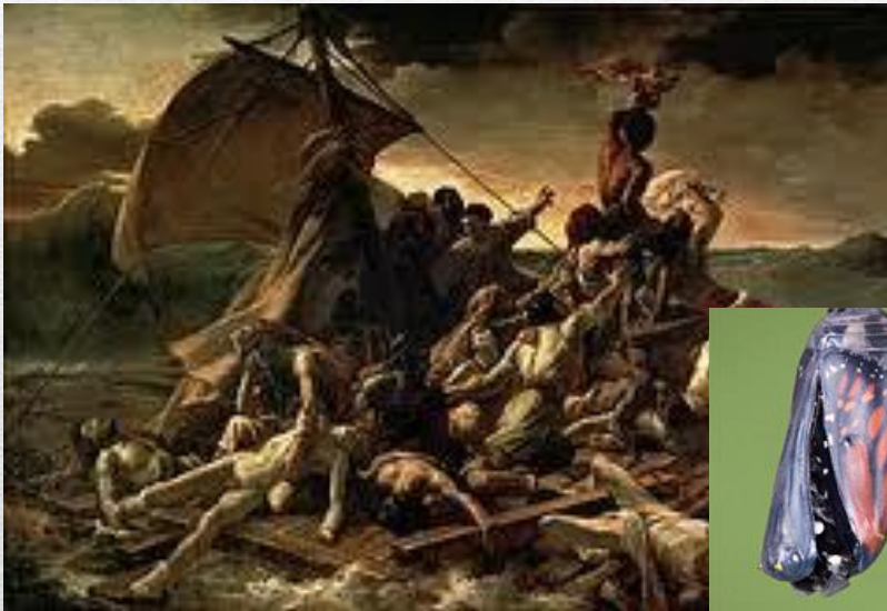
La balsa de la Medusa Gericault