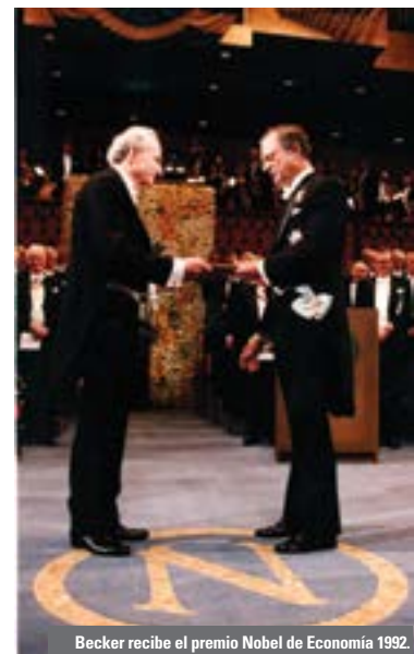
Becker recibe el premio Nobel de Economía 1992.

Esta publicación tuvo una influencia decisiva en todo lo que Becker hizo después. Treinta años más tarde, en el discurso que dio cuando recibió el premio Nobel de Economía, señaló que “distintas restricciones son decisivas en distintas situaciones, pero la restricción más fundamental es la del tiempo. El progreso económico