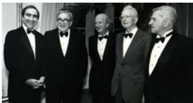
Hugo Sonnenschein (Pres. de la Universidad de Chicago entre 1993 y 2000), Robert Fogel (Nobel en Economía 1993), Gary Becker (Nobel en Economía 1992), Ronald Coase (Nobel en Economía 1991) y Merton Miller (Nobel en Economía 1990).

Según George Stigler (Nobel de Economía en 1982) "Gary Becker bien podría pasar a la historia como el principal arquitecto en el diseño de una ciencia verdaderamente general de la sociedad". La amplia variedad de temas sobre los que trabajó, desde la demanda por hijos, pasando por el mercado de matrimonios, la adicción, la discriminación o el mercado de órganos para trasplantes, parecerían obra de distintos autores provenientes de distintas disciplinas; sin embargo poseen un denominador común: la aplicación sistemática del análisis económico para entender mejor el mundo que nos rodea.