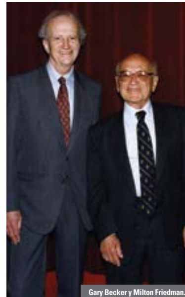
Gary Becker y Milton Friedman.

En la Economía del Crimen, Becker incorpora las actividades ilegales al comportamiento racional, mediante el supuesto que los criminales poseen las mismas motivaciones que cualquier otra persona en la sociedad. El enfoque racional implica que algunos optan por transformarse en criminales por la recompensa que les provee el crimen en comparación con la que podrían obtener en el sector legal, teniendo en cuenta las chances de ser apresados y condenados, y la severidad del